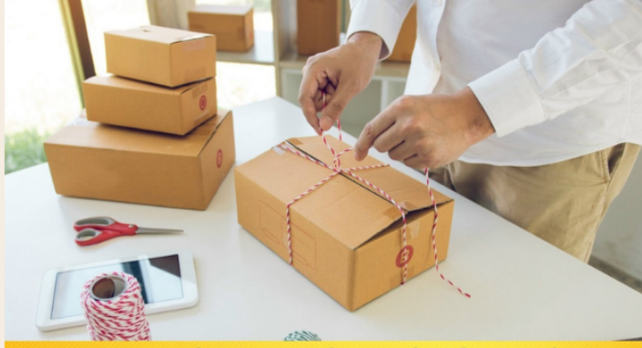
DỊCH VỤ DÁN TEM, ĐÓNG GÓI HÀNG HÓA