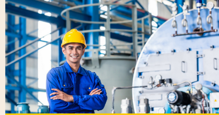
DỊCH VỤ CHO THUÊ LAO ĐỘNG THỜI VỤ