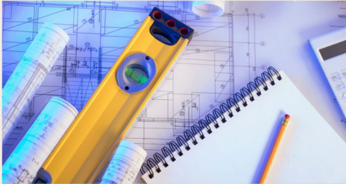
DỊCH VỤ THẦU KHOÁN TỔNG HỢP