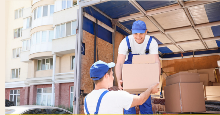
DỊCH VỤ BỐC XẾP HÀNG HÓA