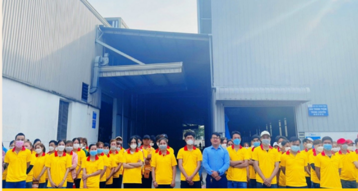
DỊCH VỤ CHO THUÊ LAO ĐỘNG