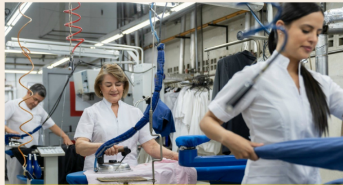
CHO THUÊ LAO ĐỘNG CÓ TAY NGHỀ